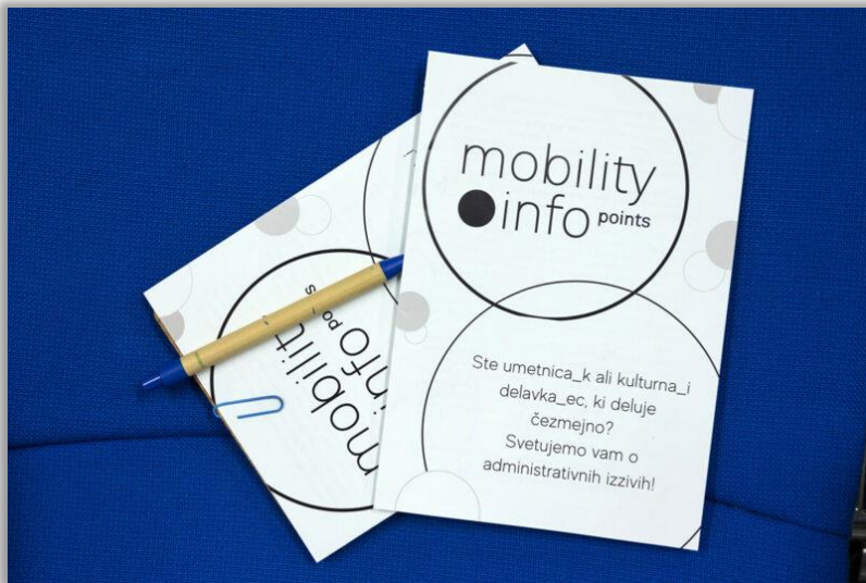
MIP v Ljubljani.